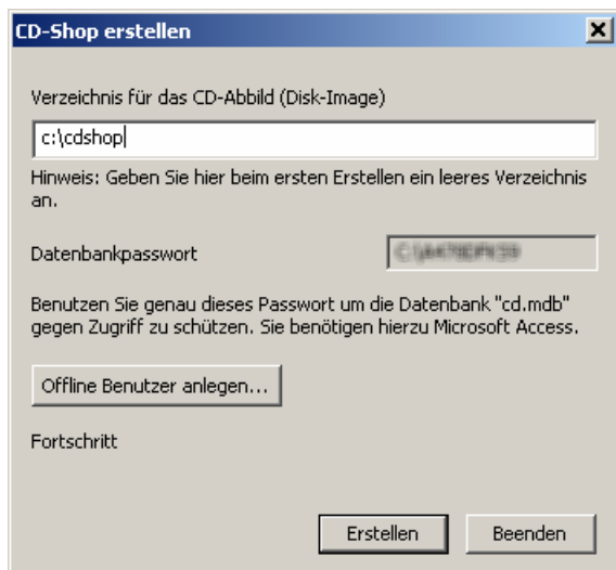
Abbildung: CD-Image erstellen

Für diesen Kundenkreis wäre ein Katalog oder Shop auf CD eine große Hilfe. Dabei ist eine CD sehr viel preiswerter als die Erstellung und Produktion eines gedruckten Katalogs.